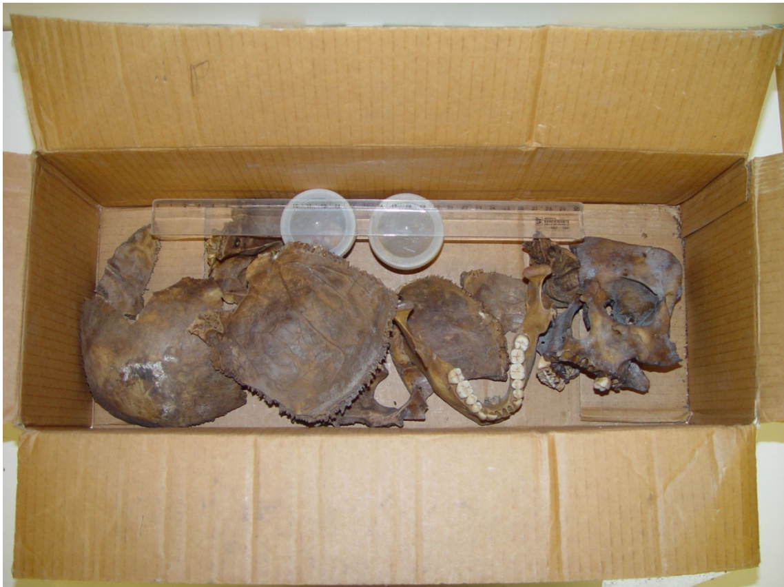
Figura 1: Fragmentos ósseos examinados.

Durante a inspeção visual, reconstruiu-se o crânio e foi constatada a existência de um orifício localizado na parte inferior esquerda do osso occipital (região da nuca), que estava fraturado em quatro partes, com sinal de funil 1 característico de orifícios de entrada de projétil de arma de fogo, conforme ilustrado na Figura 2.